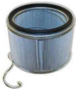
HEPA-Фильтр тонкой очистки